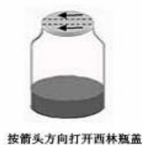
图 1 西林瓶开启图

1、开启西林瓶前，用 75%酒精棉消毒西林瓶表面，在无菌条件下，按铝盖上的箭头方向打开铝盖，撕开铝盖，打开西林瓶胶塞（如图 1）。所有的西林瓶在使用后均高压灭菌后方可弃去。